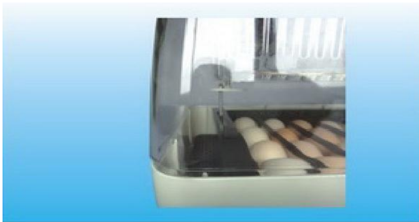
Obr. 4: Dbejte na to aby tyčka byla vložena do kanálku zásobníku pro otáčení vajec. Motor otáčení vajec běží tak dlouho, dokud je přístroj zapnutý. Spouští jeden cyklus každé čtyři hodiny, takže je velmi pomalý. Vajíčko je otočen jednou asi za 4 hodiny.