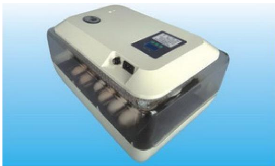
Obr. 5: Zkontrolujte, zda je kryt zcela zavřený. Přístroj může začít pracovat po zapnutí.